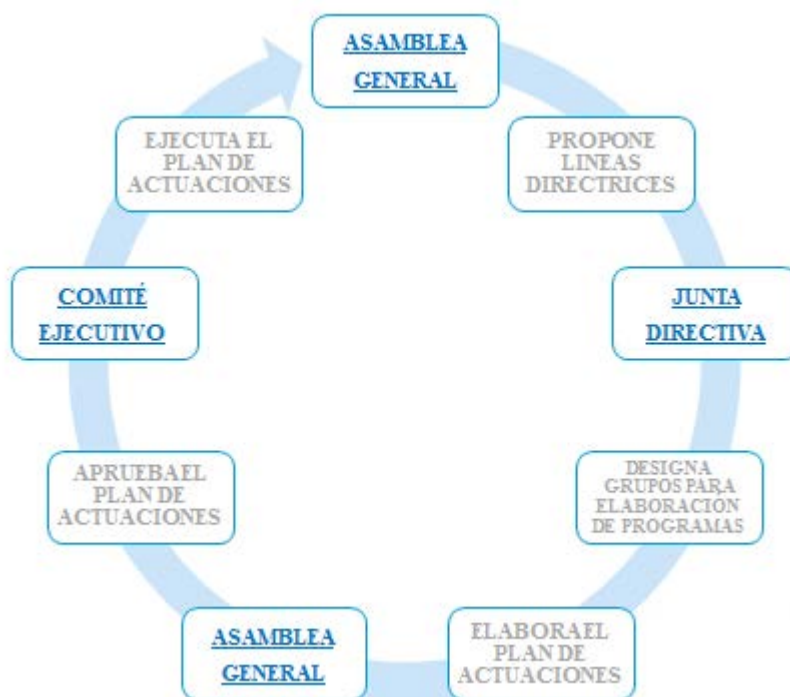
Figura 2- ELABORACIÓN, APROBACIÓN Y EJECUCIÓN DEL PLAN DE ACTUACIÓN